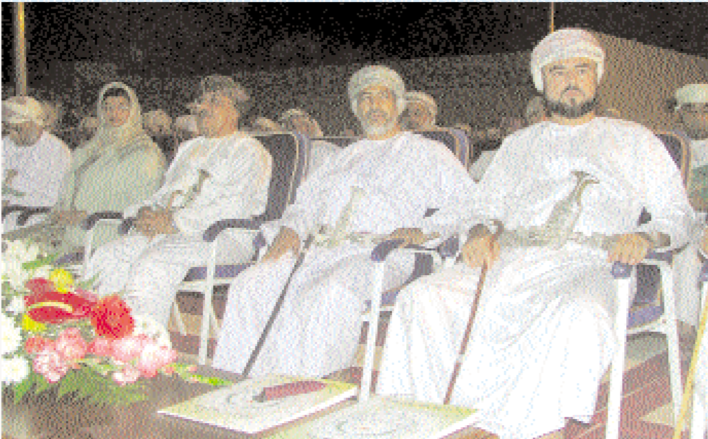
■ علي بن حمود واسعد بن طارق وعدد من الوزراء خلال الاحتفال بافتتاح المقر المبدئي لمشروع جامعة نزوى

واختتم سموه تصريحه قائلًا: إن التجاوب من رجال الاعمال موجود منذ البداية وتقديم التبرعات والمساهمات للجامعة لن يتوقف والباب مفتوح لكل من يرغب في المساهمة، مؤكداً سموه: إننا نتطلع إلى اعوام ثرية بالعلم والمعرفة والتكنولوجيا ولنا طموحات كبيرة بأن يكون لنا المساهمة الكبرى في تغطية الطلب المتزايد من الراغبين في تكملة دراستهم الجامعية والعليا مهنتا سموه جميع اعضاء اللجنة التأسيسية وأعضاء مجلس الامناء والمجلس الجامعي المشرفين على الدفعة الاولى مباركا لجميع ابناء السلطنة بصفة عامة وابناء المنطقة الداخلية بصفة خاصة على مشروع جامعة نزوى،