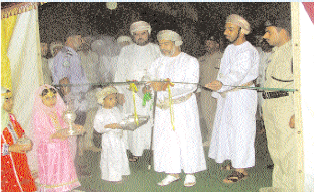
■ وخلال افتتاح المعرض المصاحب للأسبوع الثقافي الأول

■ خطت جامعة نزوى خطوة متقدمة في اطار تنفيذ واقامة الحرم الرئيسي المتكامل للجامعة وذلك بتوقيع اتفاقيتين هامتين تتعلقان بتوفير التمويل اللازم لبناء وتجهيز الحرم الرئيسي للجامعة على أساس نظام التاجير للشملك محددة وتعيين شركة بريماس ميدل إيست العالمية - سنغافورة، كعقاول رئيسي مشرف على تنفيذ المشروع على نظام (تسليم المفاتيح). توقيع الاتفاقيتين جاء ضمن فعاليات الاحتفال الرسمي بتدشين الحرم المبدئي للجامعة ببركة الموز بنزوى، الذي اقيم مؤخرًا، ووقعها عن جامعة نزوى صاحب السمو السيد أسعد بن طارق آل سعيد رئيس مجلس أمناء جامعة نزوى وعن شركة بريماس ميدل إيست العالمية السنغافورية الرئيس التنفيذي للشركة سعاده أنتوني سيا وعن شركة القارات الثلاث العالمية للكتورة شيخة بنت علي المسكري رئيسة مجلس الإدارة بحضور عدد من أعضاء مجلس أمناء جامعة نزوى والمجلس الأكاديمي للجامعة.