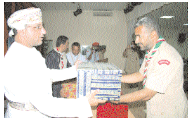
■ راعي الحفل يكرم احد المشاركين في المخيم

وجوالا من مختلف أنحاء السلطنة كما شارك في المخيم وفد كويتي يضم نخبة للكشافة والمرشدين بصفة خاصة لدعم وخدمة الحركة الكشفية قدم الكشافة في دولة الكويت الشقيقة بدأ الأسبوع الكشفي مساء يوم الأربعاء بتجمع الجوالاة والكشافة من مختلف مناطق السلطنة في المخيم الكشفي الدائم بالمنطقة الداخلية للمخيم. وحمل المخيم الكشفي السنوي الثاني والثلاثين شعار حافظ على هويتك .. واعتز بتراثك .. وتسامح مع الآخرين هذا الشعار وقد شارك في المخيم الكشفي السنوي جوالاة جامعة نزوى بتنظيم عدة الهيئة القومية للكشافة والمرشدين في ليعود الجميع مساء يوم الجمعة لمواصلة السلطنة وبمشاركة أكثر من ١٨٠ كشافا