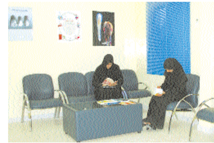
■ امكانيات واجهزة عالية التقنية يقدمها مركز جنى الطبي