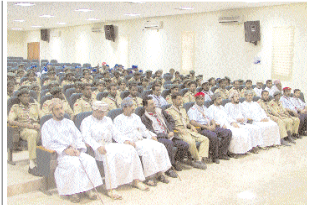
■ جانب من الحضور