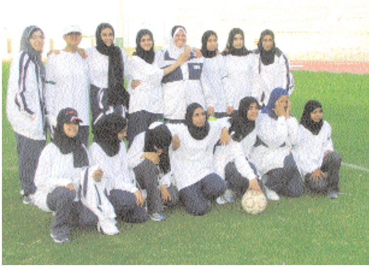
■ الفريق النسائي