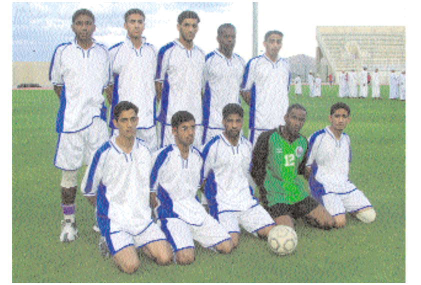
■ أحد الفرق الرياضية للجامعة

■ اعتبر عدد من أعضاء الهيئة التدريسية وموظفي جامعة نزوى، ان جامعة نزوى تمثل صرحاً علمياً شامخاً، ومركزاً متميزاً يسعى نحو الجودة، ويروم توفير بيئة علمية رفيعة تتعهد الطالب فتصقل مواهبه وتنمي قدراته، ناهلاً من تراث وطنه العظيم، متشرباً بالقيم الإنسانية السامية، مشيرين إلى ان الجامعة ستنبؤ مكانة رفيعة وتسهم في رفد قطاع التعليم الأكاديمي الخاص بما يعزز جهود الحكومة الرشيدة في فتح مجالات وتخصصات جديدة امام الطلبة ■