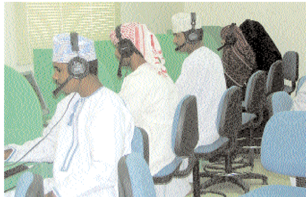
■ طلبة الجامعة يحظون بإمكانيات عالية من التدريب والتأهيل